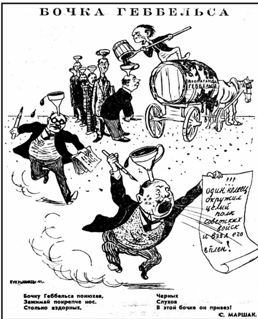
Бочку Геббельса понюхав, Замкаяй покрепче нос. Столько вздорных, Черных Служок В этой бочке он привез!

Клевета и ложь — узаконенный метод политики мешан.