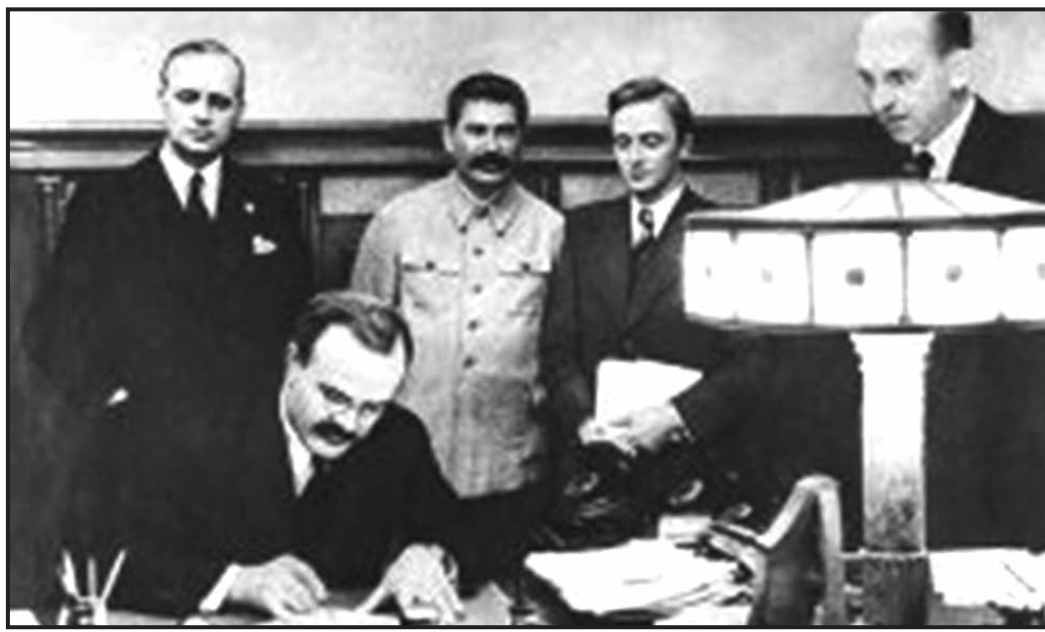
Эти соглашения находятся в прямой связи друг с другом — в каком-то смысле Риббентроп, заключающий пакт с Молотовым, уже фактически предопределял соглашение о сдаче германских вооружённых сил.

Но план не сработал — путч был подавлен, а вскоре, когда в немецком государстве вспыхнула революция, даже самым решительным, но адекватным критиком Владимиром Ильичем стало ясно, что он сделал гениальный ход. Пожертвовав очень многим, оказавшись в ещё большем меньшинстве, чем М.И. Кутузов, гениальный В.И. Ленин пошёл на кабальные условия, лишь бы спасти молодую республику Советов. Собственно, злорада в его адрес со стороны контрреволюционных элементов тех лет во многом и объясняется тем, что он сумел уберечь от кайзеровского сапога хрупкую ещё Советскую власть.